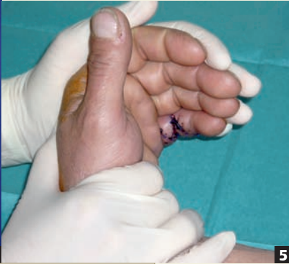
Abb. 5 In der frühen Rehapphase findet die Therapie in Protektionsstellung der Hand statt.